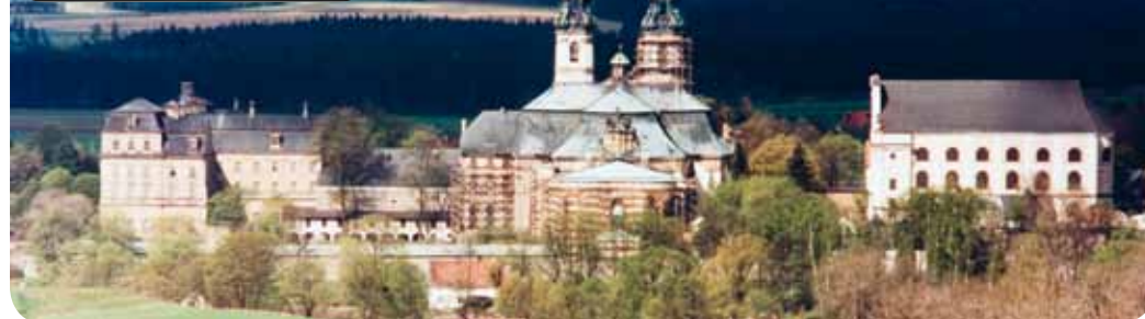
Kloster Grüssau in Schlesien am Riesengebirge.

alle Prüfungen bestanden hat, spricht nichts gegen ihn /sie. Dann hat er/sie ja auch längst den „Sprachtest“ hinter sich. Polizeidienst? Da könnte es knifflige Situationen geben, Beispiel Ausländerkriminalität. Soldatendienst? Sind wir, nach dem Wegfall der Wehrpflicht, auf dem Weg zur „Fremdenlektion“? Sind türkisch- und arabischstämmige Soldaten nicht von Haus aus ein Sicherheitsrisiko? Wie steht es auch mit ausländischen Geistlichen, die vielleicht verbeamtet werden können? In der katholischen Kirche helfen viele Polen oder Inder aus. Ohne sie müsste manche Pfarrei schnell geschlossen werden. Aber dürfen und sollen diese ausländischen Patres auf Dauer bleiben? Bei gleicher Bezahlung wie einheimische?